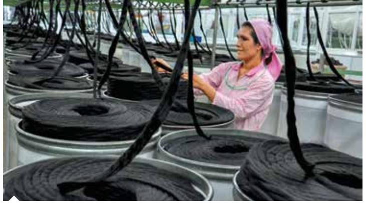
Tekstil sektörü pamuk ihtiyacının yüzde 43’ünü yerli üreticilerden karşılarken, yaklaşık 935 bin ton lif pamuk ithal etmek zorunda kaldı.

bin tonluk ve özel sektörün 15 bin tonluk lisanslı deposu bulunmaktadır.” dedi.