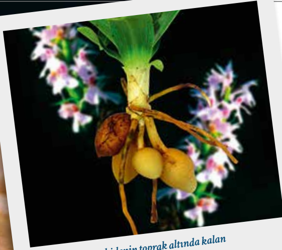
Sahlep, yabani orkidenin toprak altında kalan yumrularından elde ediliyor.