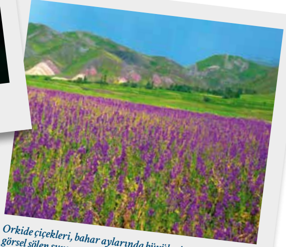
Orkide çiçekleri, bahar aylarında büyüleyici renkleriyle görsel şölen sunuyor.

A nadolu'nun endemik bitki türlerinden yabani orkide çiçeğinin yumrularından elde edilen sahleple, kış günlerinde soğuklardan korunmak için sıcak bir alternatif sunuyor. Osmanlı'dan günümüze geleneksel damak tadına hitap eden sahleple içeceği, hoş kokusu ve şifalı özelliğiyle çokça tüketiliyor.