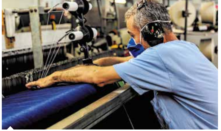
Türk tekstil sektöründe dokuma kumaş üretimindeki kurulu kapasite 1,5 milyon ton, örme kumaş üretimindeki kapasite ise 2,5 milyon ton düzeyine ulaştı.

Türkiye'de tekstil endüstrisinin gelişimine ters orantılı olarak pamuk üretiminin yıllar içinde azaldığını kaydeden Başkan Doğan, çiftçilerin pamuğa alternatif olarak mısır, soya, yer fıstığı ve narenciye üretimine yöneldiğini, 975 bin ton olan kütlü pamuk üretiminin son yıllarda 450 bin tona kadar